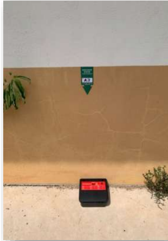
TAMPER RESISTANT BAIT STATION (TRBS)